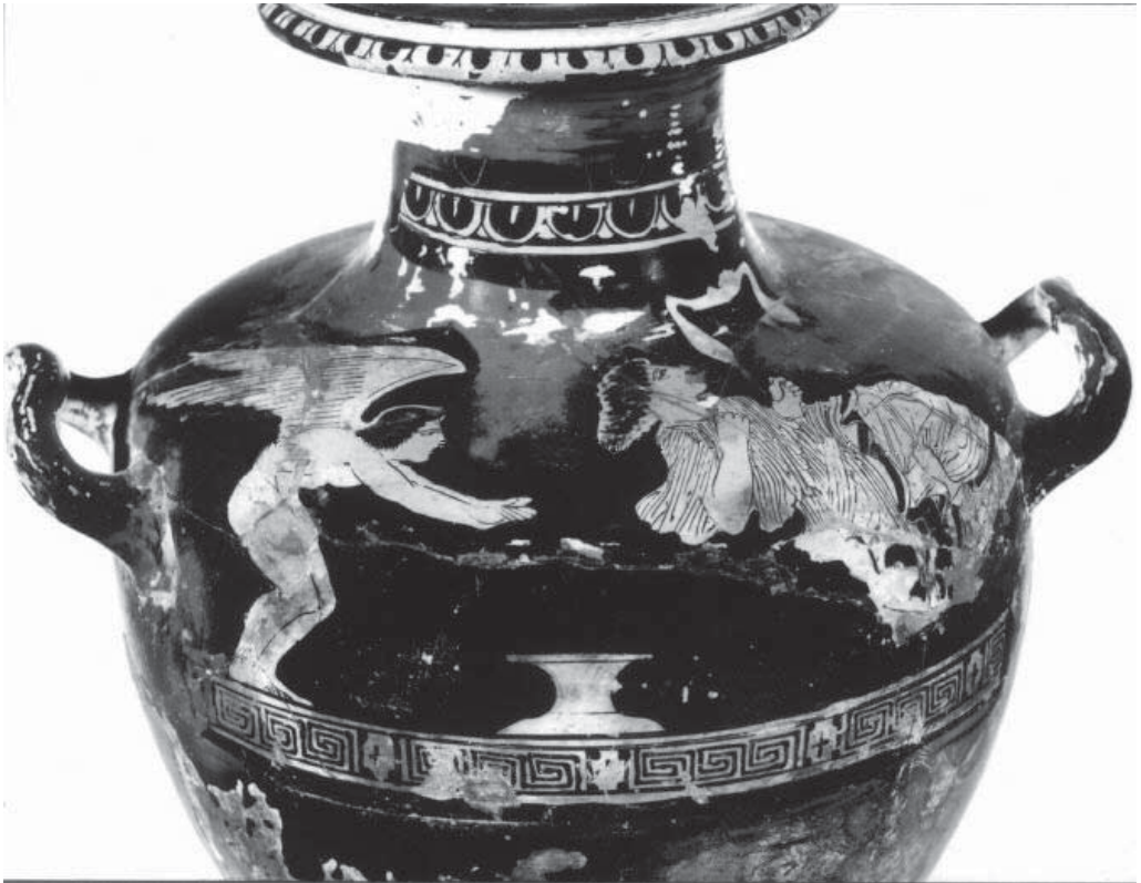
Рис.5. Краснофигурная гидрия. Лувр.

ную связь 37 . Следует отметить, что для греческого мифологического сознания характерен топос самоубийства девушки через повешение. На фоне общего преобладания мужских самоубийств в исторических и мифологических источниках выделяется равное численное соотношение между мужскими и женскими самоповешениями. Автор исследования о суициде 38 А. ван Хофф отмечает, что подлинные самоубийства, совершаемые женщинами, не привлекали особого внимания античных наблюдателей жизни, бытописателей, но в разного рода мифах и повествованиях интерес к женскому суицидальному поведению, особенно самоповешению, был весьма велик 39 . Отражением представления о частом самоповешении девушек является трактат Гиппократова корпуса «О девичьих болезнях». Автор этого трактата утверждает, что девушки составляли некую группу риска в отношении самоубийств, объясняя этот факт физиологическими