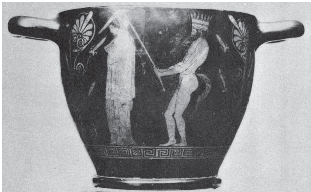
Рис.4. Краснофигурный аттический скифос. Берлин. Обратная сторона.

гидрия из Берлинской коллекции (рис. 6) 34 . На первом сосуде Эрос раскачивает женщину на качелях, между ними пифос, вкопанный в землю, сверху подвешена лента, и на втором женщину на качелях раскачивает другая женщина, в землю вкопан пифос, сзади – другой сосуд, сверху – подвешенная лента. В точности такие же подвешенные ленты присутствуют обычно на вазах, изображающих свадьбу. Буркерт считает их символом плодородия 35 . Не стоит забывать, что второй день Анфестерий, праздник Кружек, тесно связан с ритуалами взросления мальчиков. Не будет ошибкой предположить, что и для девочек в этот день предусматривались определённые обряды перехода, в том числе Эоры 36 .