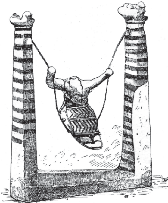
Рис. 1. Статуэтка девушки на качелях. Ираклион. Реконструкция.

В археологическом музее города Ираклион части статуэтки восстановлены в виде девушки, качающейся на качелях, которые подвешены веревками к двум колоннам. Такая реконструкция представляется правильной и единственно возможной 3 . Кроме отверстий в колоннах, а также бедрах и руках фигурки, об этом свидетельствует и ее необычная поза. Девушка не стоит, но и не сидит, а немного согнута, как будто собирается прислониться к краю сидения или к тонкому длинному предмету: палке или, скорее, веревке, которая, видимо, и должна была проходить через бедра статуэтки. При этом девушка не просто безжизненно висит на веревке (т.к. в таком случае по закону силы тяжести она бы перевернулась головой вниз), а только опирается на нее, держась двумя руками – как будто качается на качелях 4 (рис. 1-2).