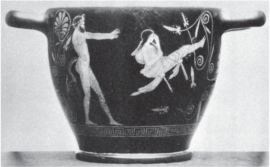
Рис.3. Краснофигурный аттический скифос. Берлин.

Другой смысл качелей – очищение воздухом – находим уже в комментариях Сервия 19 . В этиологической мифе об Эригоне присутствует этот мотив очищения от скверны. Качание как очищение воздухом хорошо согласуется с этиологическим мифом дня Кружек – очищение Ореста от скверны матереубийства. Этой вер-