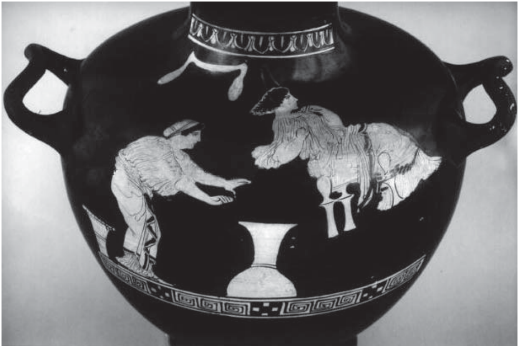
Рис.6. Краснофигурная гидрия. Берлин.

В-третьих, минойское происхождение имеют мифы о самоповешении девушек и молодых женщин 51 , которое воспринималось древними греками как эквивалент качания на качелях и функционировало в мифологии как один из аспек-